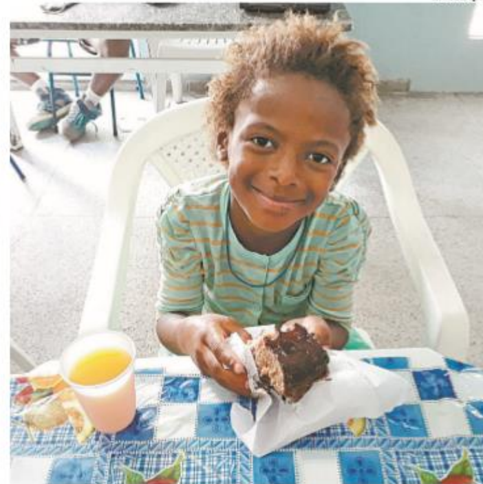
Criança atendida pela Ação Querer Bem Social, em Jacarepaguá